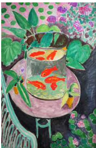
Henri Matisse, Intérieur, bocal de poissons rouges , 1914