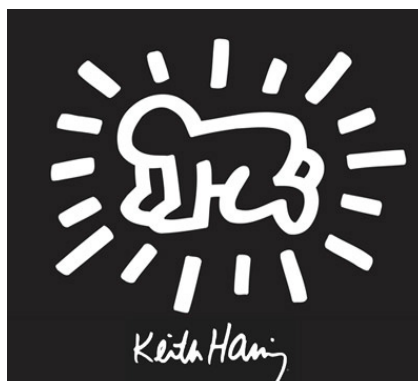
Keith Haring, Bébés Radiants , 1979