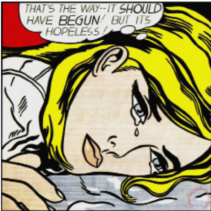
Roy Lichtenstein, Hopeless , 1963

Cette oeuvre intitulée Digital Modern regroupe plusieurs références à des artistes ayant vécu avant l'ère du numérique.