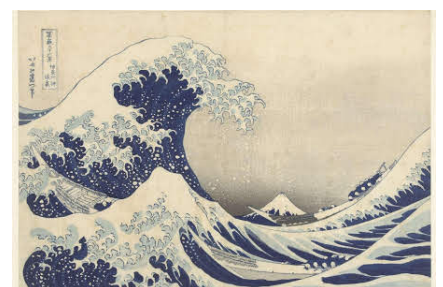
Hokusai, La Grande Vague de Kanagawa , 1930